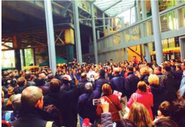
26.04.2015. Orfeó Català. Borough Market. Londres