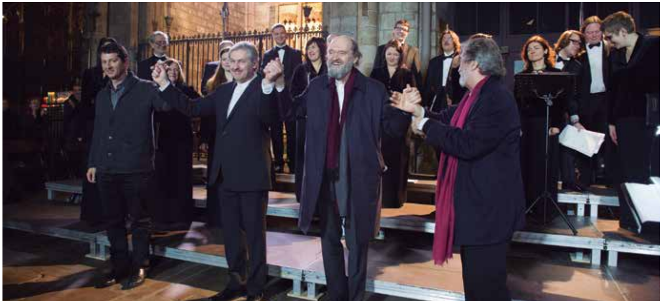
06.03.2015. Arvo Pärt en un dels concerts organitzats amb motiu del seu 80è aniversari. Santa Maria del Pi