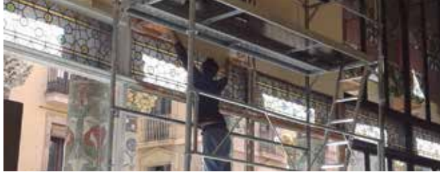
Restauració de la fusteria i dels vitralls de la Sala Lluís Millet