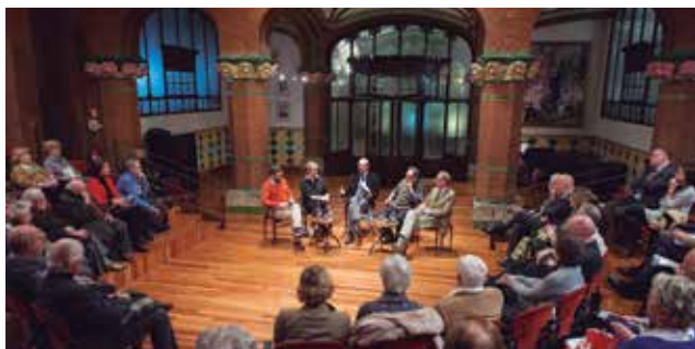
27.01.2015. Col·loqui organitzat per la «Revista Musical Catalana»

A més dels actes que organitzen la Fundació Orfeó Català-Palau de la Música Catalana i l'Associació Orfeó Català, altres empreses i particulars escullen el Palau de la Música Catalana per celebrar-hi tot tipus d'esdeveniments culturals, socials i empresarials. El 2015, els diversos espais que el Palau ofereix: Sala de Concerts, Sala Lluís Millet, Sala d'Assaig de l'Orfeó Català, Plaça del Palau, Foyer i Petit Palau, van acollir una setantena d'actes entre rodes de premsa, celebracions, recepcions, presentacions de llibres i discos, exposicions, congressos, convencions, reunions, conferències, rodatges, cerimònies de graduació, etc. Els actes més destacats celebrats durant el 2015 van ser: el reconeixement a Victòria de los Àngeles, amb la col·locació del seu bust a la Sala Lluís Millet; el Premi d'Honor de les Lletres Catalanes; el programa de Nadal d' El món a RAC1 ; la cloenda del Cineposium, esdeveniment organitzat per l'Associació Internacional de Film Commissioners; el col·loqui de la crítica organitzat per la «Revista Musical Catalana», o la preestrena al Petit Palau d'un episodi de la sèrie Catalunya Experience , amb la presència de l'actor Nigel Planer, més conegut com a Neil de la sèrie Els joves . També cal destacar les conferències de divulgació musical organitzades per la Fundació, com ara els cicles de conferències “Història de la música antiga al Palau” i “L'art de la direcció musical”, a més dels “Parlem de música” a l'entorn dels concerts de Palau 100.