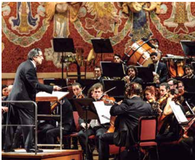
22.03.2015. Riccardo Muti. Orquestra Giovanile Luigi Cherubini. Palau 100