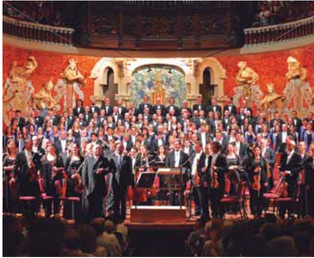
07.07.2015. Orfeó Català i Cor de Cambra del Palau. Staatskapelle de Berlín. Daniel Barenboim