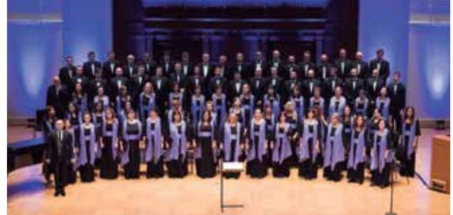
26.04.2015. Orfeó Català. Cadogan Hall. Festival Choral at Cadogan. Londres