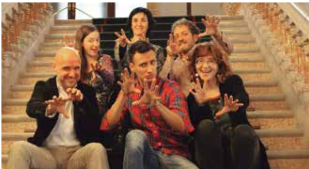
22.12.2015. Roda de premsa. Presentació del Concert de Sant Esteve amb el Mag Lari