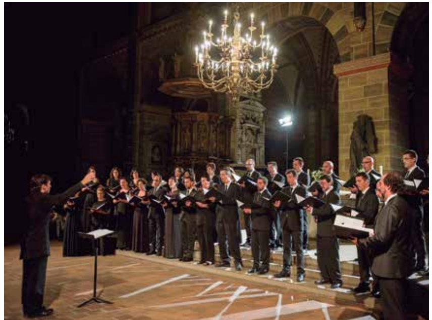
29.08.2015. Cor de Cambra del Palau. St. Petri Dom. Musikfest. Bremen

També el Cor de Noies de l'Orfeó Català va traspasar fronteres amb dos concerts a Ljubljana i Nova Gorica (Eslovènia), en un viatge d'intercanvi amb el cor de noies Bodeča Neža. El nivell i la maduresa dels cors de l'Escola Coral assolits en el transcurs dels darrers anys permet que aquestes formacions estiguin en condicions d'afrontar compromisos internacionals que els enriqueixen tant a nivell musical com personal, en entrar en contacte amb altres cultures.