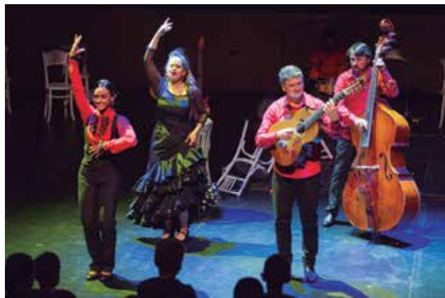
24.05.2015. Estrena de l'espectacle Flamenkids.cat . Petit Palau