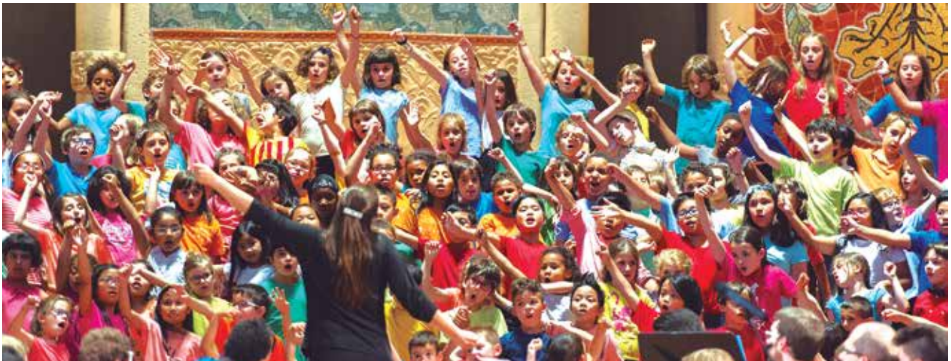
07.06.2015. Concert de fi de curs dels cors del projecte Clavé XXI

Com a final de curs els cors del projecte van protagonitzar plegats "Un concert de pel·lícula" al Palau, amb la presència de les famílies dels cantaires. A partir del 2015, el cors de Clavé XXI participaran de manera regular en el concert anual d' El Messies' familiar que organitza "la Caixa" al Palau de la Música. Igualment, els cors, educadors i les famílies col·laboren amb l'Orquestra Simfònica del Vallès i amb el Concurs Maria Canals en actuacions i concerts esporàdics. I a més, cada una de les formacions segueix una activitat pròpia, amb una línia individual que inclou petits concerts al llarg de l'any.