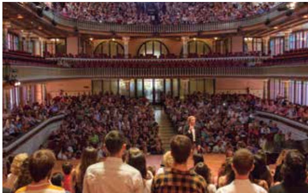
21.06.2015. Taller de cant coral. Jornada de Portes Obertes