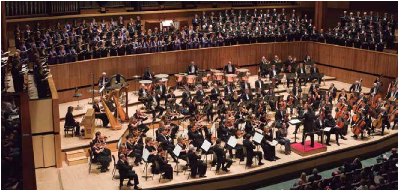
25.04.2015. Orfeó Català i Cor de Cambra del Palau. Royal Festival Hall. Londres