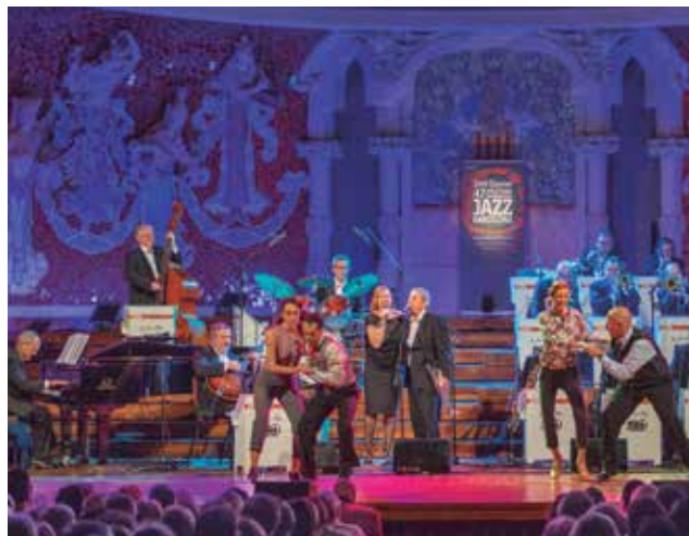
11.12.2015. La Locomotora Negra. 47 Voll-Damm Festival Internacional de Jazz de Barcelona