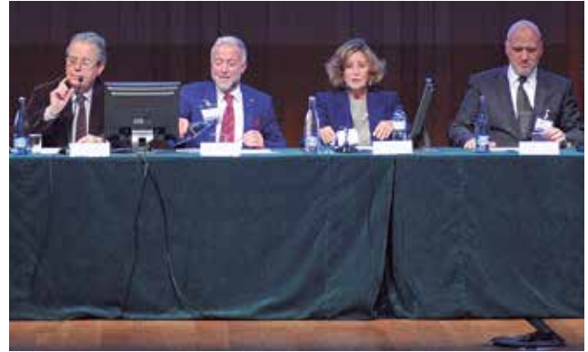
10.02.2015. Assemblea Extraordinària de Socis de l'Orfeó Català