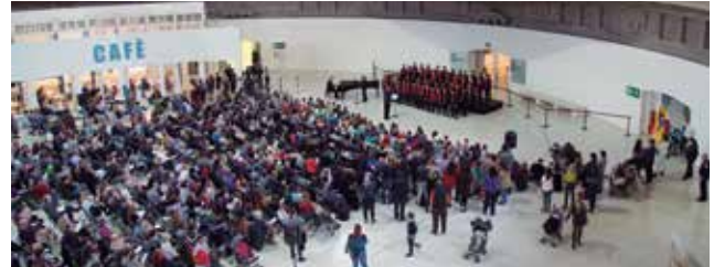
20.12.2015. Cor Infantil de l’Orfeó Català. MNAC