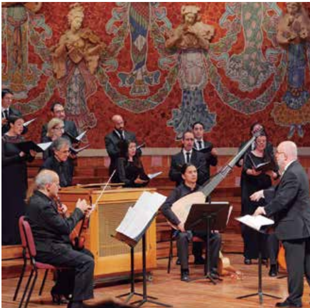
17.05.2015. Concert del 25è aniversari del Cor de Cambra