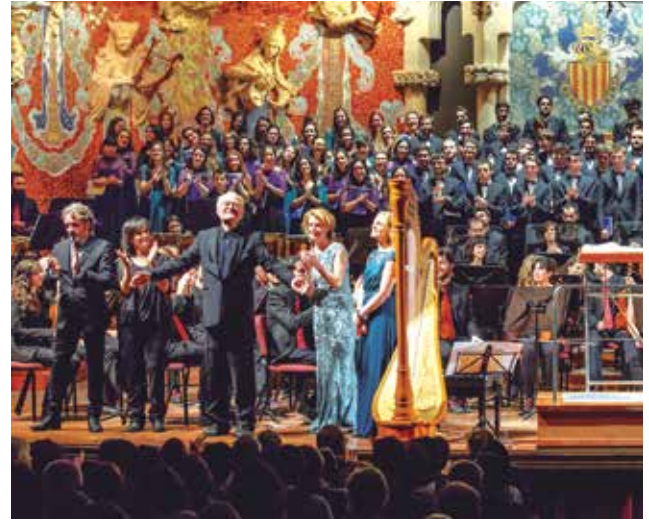
26.11.2015. Cor Jove i Cor de Noies de l'Orfeó Català. John Rutter