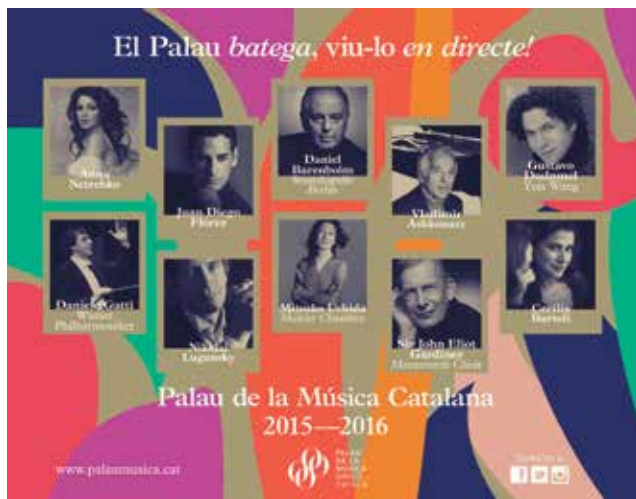
20.03.2015. Imatge de la temporada 2015-16 de la Fundació OC-PMC