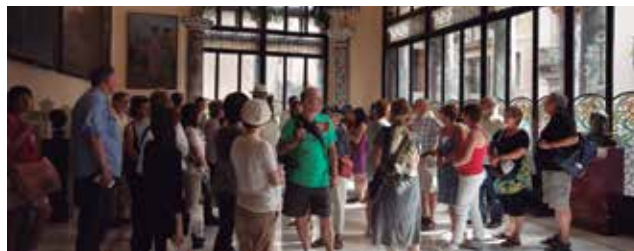
Visitants a la Sala Lluís Millet del Palau de la Música Catalana