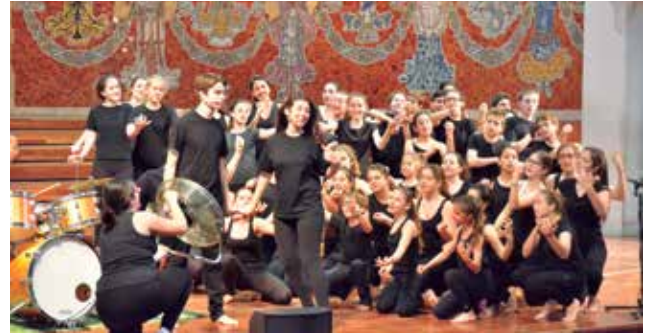
10.05.2015. Cor Infantil de l'Orfeó Català. My favorite things