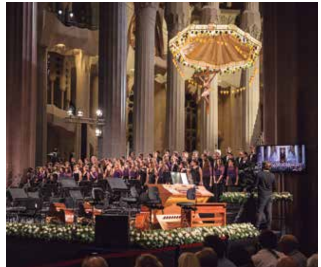
20.09.2015. Cor Jove de l'Orfeó Català. Concert inaugural de la temporada de l'OBC. Sagrada Família