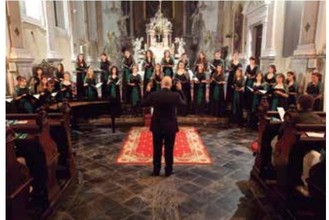
02.07.2015. Cor de Noies de l'Orfeó Català. Cerkev Sv. Jakoba. Ljubljana

El Cor de Cambra, per la seva banda, va protagonitzar tres concerts a capella en la jornada inaugural del prestigiós festival Musikfest de Bremen i una gira amb l'Ensemble Matheus, sota la direcció del francès Jean-Christophe Spinosi, per oferir la Missa Solemnis, en Re major, op. 123 de Ludwig van Beethoven, amb concerts al cicle Palau 100 i a Ais de Provença i Dortmund.