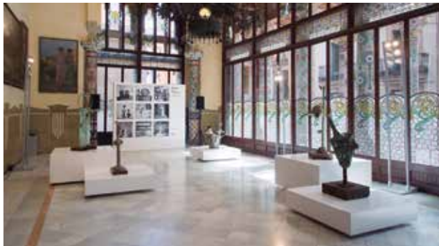
11.05.2015. Exposició “Joan Miró: arrels”