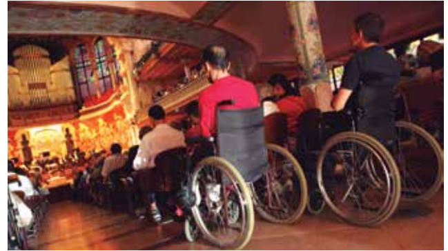
Col·lectiu d'Apropa Cultura al Palau de la Música Catalana