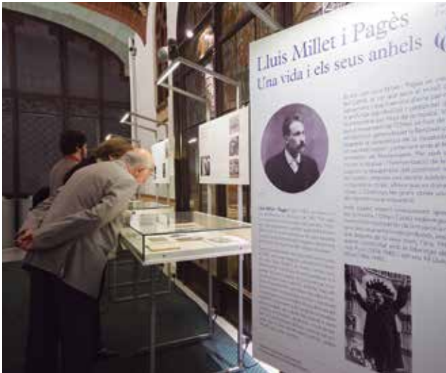
16.11.2015. Exposició "Lluís Millet i Pagès. Una vida i els seus anhels"