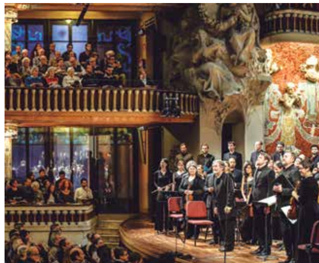
15.03.2015. Jordi Savall. Passió segons sant Mateu . Palau 100 Bach